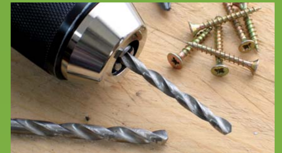
Petites réparations en tout genre