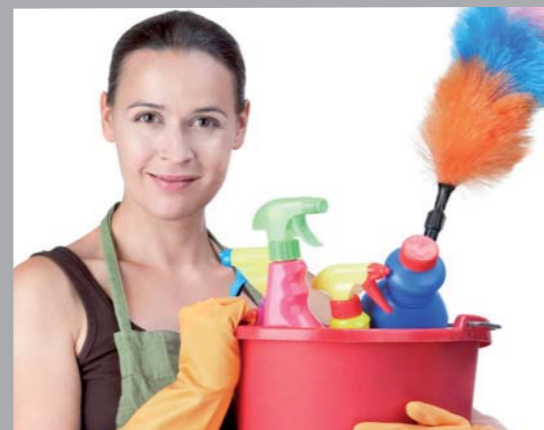
Un cahier des charges consigne l'intégralité de vos attentes