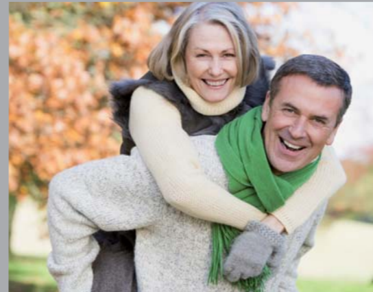
Nous vous facilitons la vie au quotidien.