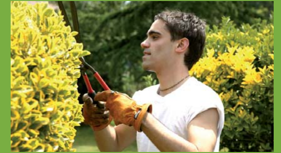
Aménagement extérieur : Espaces Verts