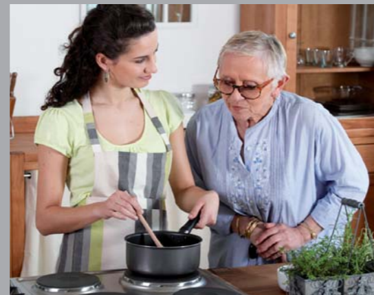
Mise en place d'un classeur de transmissions écrites